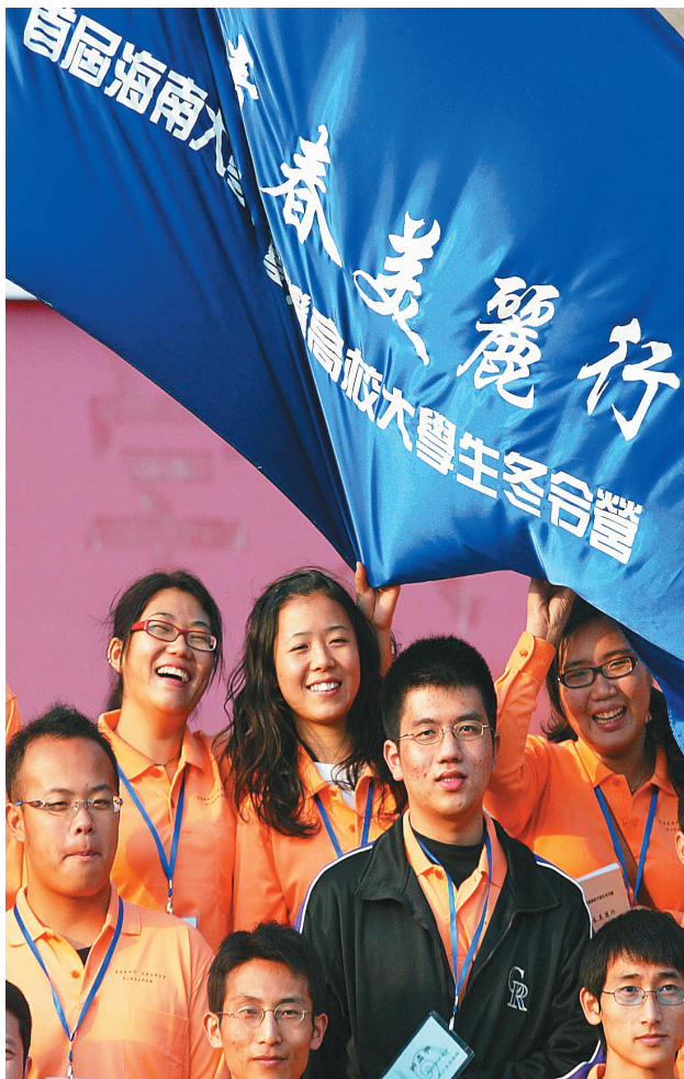
2015年2月3日,首届海南大学、台湾高校大学生冬令营正式开营。图为开营仪式后,两地大学生合影。

亲中部联络处、南部联络处等,台北市海南同乡会与台湾海南各会都有密切联系,以服务全台湾乡亲为对象,是全台湾海南乡亲精神之所寄。