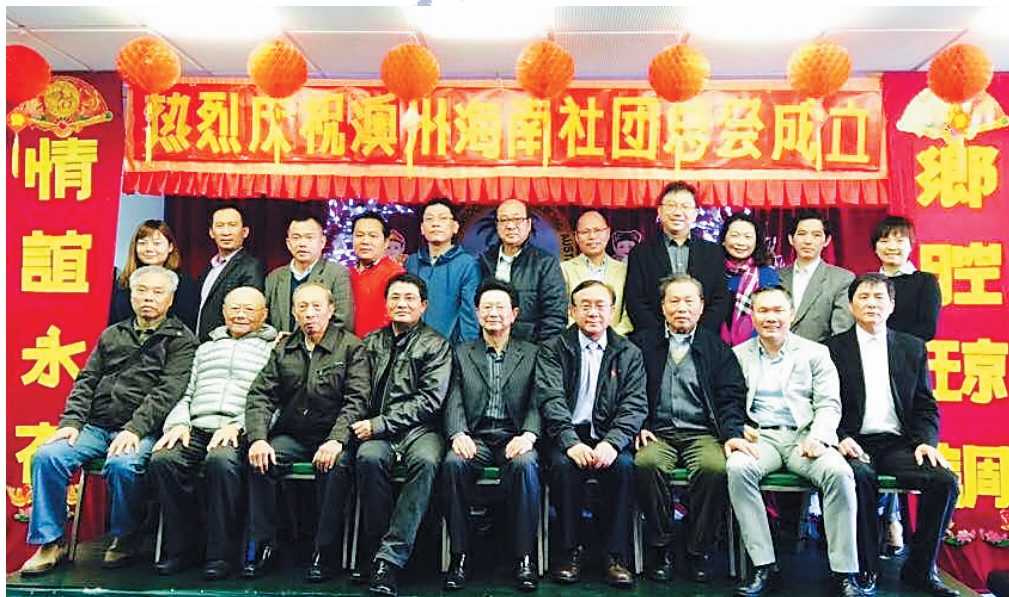
澳州海南社团总会成立合影留念