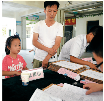
为满足进城务工人员随迁子女就近入学，安徽合肥市2015年把132所中小学确定为接收进城务工人员随迁子女的定点学校。