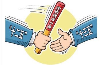
漫画:接力 新华社发 徐骏 作

这是一幅日益清晰的民生图景，与伟大复兴的中国梦呼应激荡，激励着13亿人民共同奔向更加美好的明天。