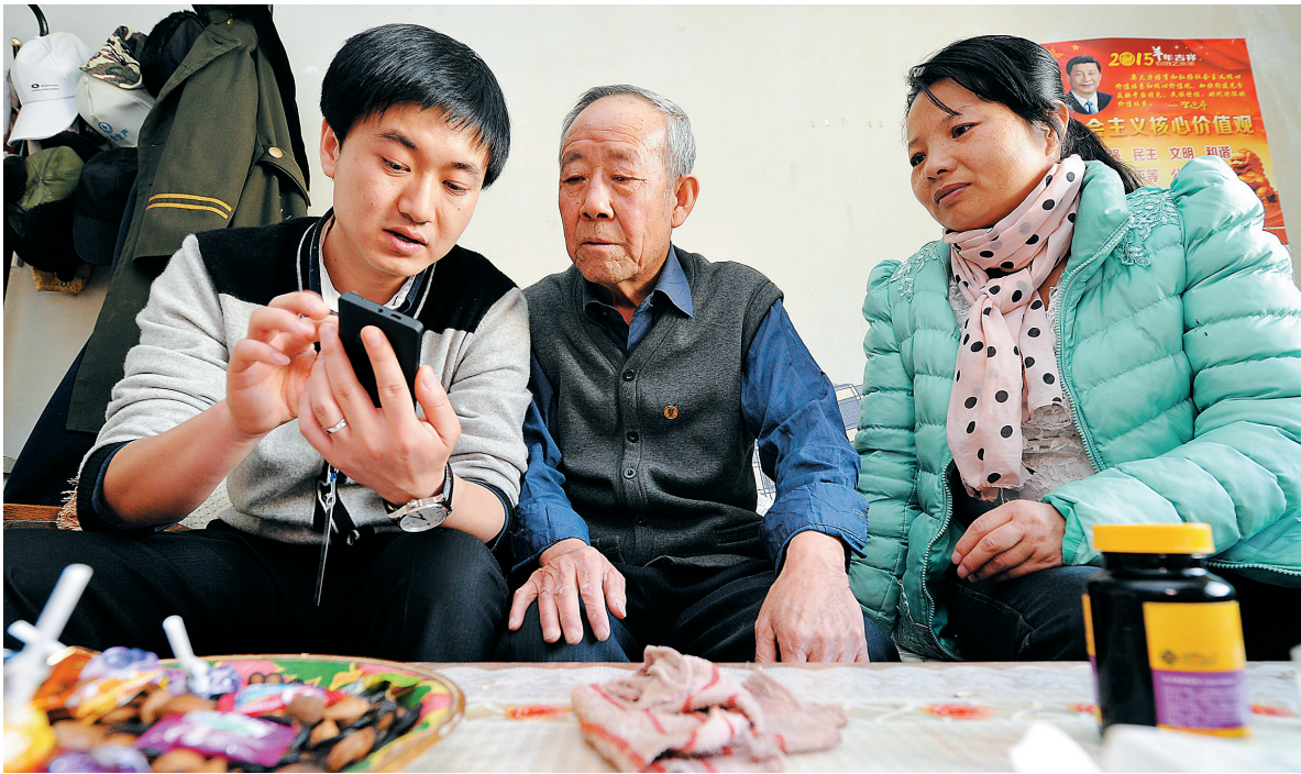
如何使用智能家居养老呼叫手机。 在宁夏回族自治区贺兰县三县马家寨社区，社区工作人员向老人介绍