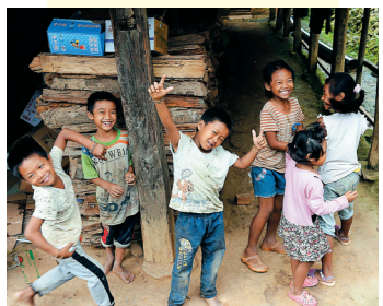
9月19日，云南省西双版纳勐海县布朗山布朗族乡曼纳山寨的几个孩子在木屋下玩耍。