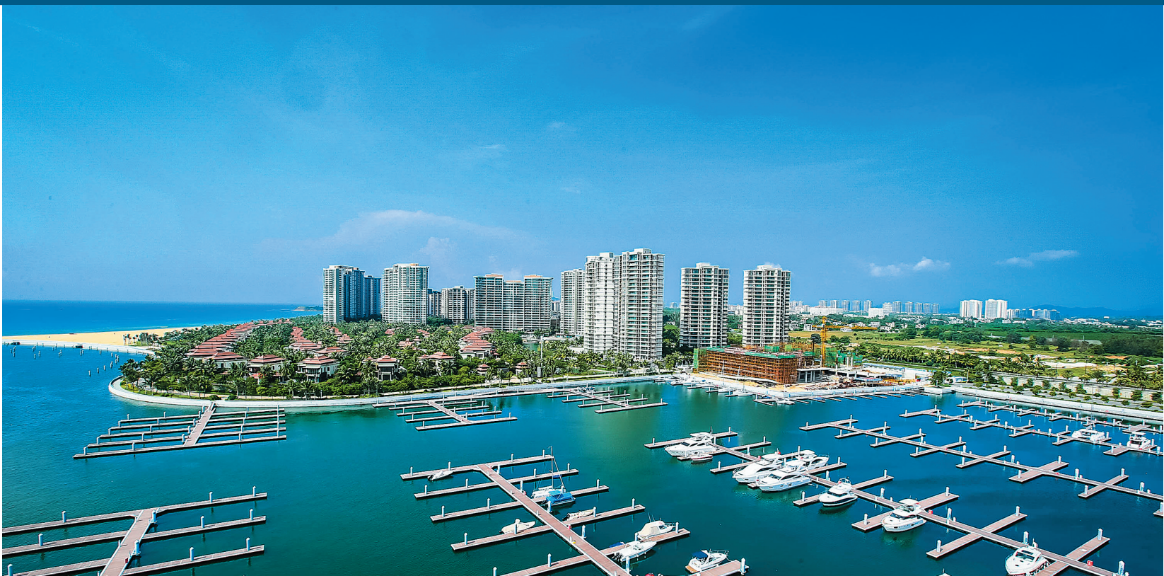
个性化旅游——海南游艇旅游发展迅猛。

总之,全域旅游更多不是一个发展目标,而是“无所不至”的旅游发展新需求,倒逼形成的一种发展旅游的新理念和新机制,是旅游发展期待达到的一种新境界,需要按照“处处都是旅游环境、人人都是旅游从业者”的更高要求,以全新的发展理念和机制加以探索 and 推进。