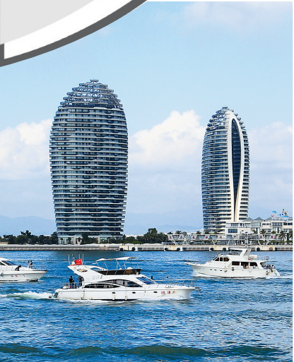
三亚港,游船、游艇络绎不绝。

今天上岛的旅客都来自哪些地方?现在哪个景区人最多,都来自哪里?今天哪个市县游客最多……放在以往,要得到这些数据,统计人员可能得忙乎上一整天甚至更久。但现在,在海南旅游综合云平台上,不需要统计人员统计计算,就可以实时获得! 在刚刚召开的全省旅游统计工作会议上,看着海南省旅游信息和咨询服务中心在“云平台”上的轻松演示,很多干了一辈子统计的人觉得有些神奇又有些不可思议。 “要让这个‘云平台’真正智慧起来,其实更需要大家及时全面地将各种数据、信息上传上来,通过信息共享,就可以分析出各种非常有针对性的实用信息。”省旅游委主任孙颖说,未来还将与相关部门协商实现相关数据的共享,数据越多,“云平台”越智慧。