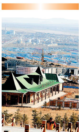
呼伦贝尔额尔古纳市湿地景区。

目前，刘军已持有4间旅店，3家是家庭旅馆，为了提升家庭旅馆的运营水平，她联合了一家房地产商在室韦建起了精品家庭旅馆，希望通过精品住宿的打造进一步提升家庭旅馆的服务水平。