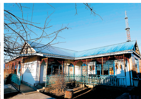
室韦的美丽风光。