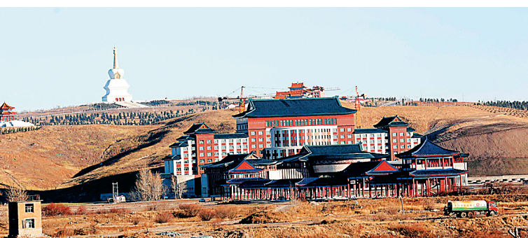
呼伦贝尔市海拉尔区一角。

为深入挖掘和展示当地特色的蒙兀文化，内蒙古自治区在室韦投资兴建了一座蒙源文化博物馆，并正着力打造蒙兀室韦文化旅游景区。