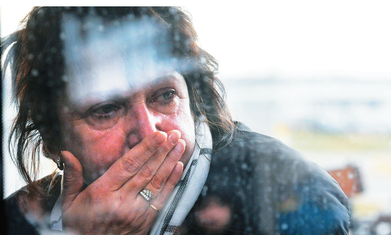
10月31日，一名坠机乘客家属在俄罗斯圣彼得堡的机场哭泣。

一架搭载200多名乘客和机组人员的俄罗斯客机10月31日在埃及西奈半岛哈桑纳地区坠毁。埃及官员说，数十辆救护车赶到坠机现场，已找到众多遇难者遗体。俄罗斯驻埃及大使馆当天晚些时候说，无人生还。俄总统普京当日签署法令，宣布11月1日为全国哀悼日。目前坠机原因尚无定论，怀疑为飞机技术故障。