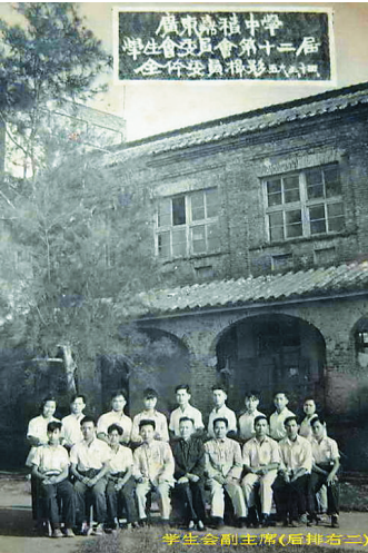
1956年嘉积中学学生会干部合影。

抗战时期，烽火连天。彼时，炮弹、牺牲，琼海嘉积中学在艰难困苦中愈发强大；彼时，抗争、迁徙，嘉积中学在颠沛流离中发展壮大。