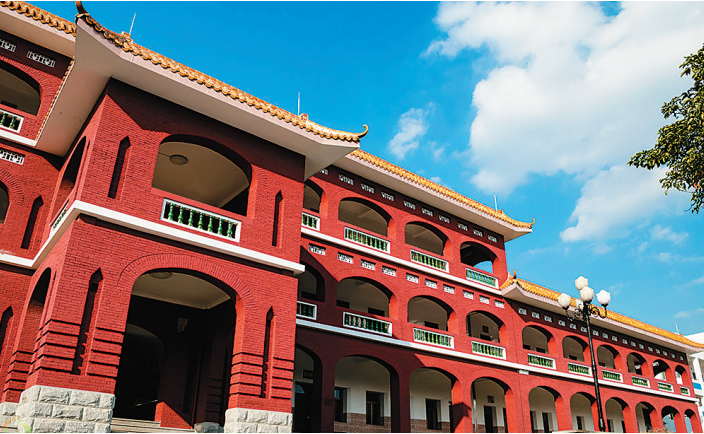
1946年，琼崖中学迁至原日军左八特陆战队司令部营房，办学至今。

那时生活贫困，物质缺乏，不少学生靠典当旧衣物过日子。每天吃省府拨下来的又粗又霉的黄米饭，再嚼几根白菜或萝卜干。由于蚊子多，不少人患上了疟疾。虽然如此，但是学生们怀有抗战救国的崇高理想，所以学习的劲头很高，晚上伏在昏暗的桐油灯下读书，一直坚持到深夜，第二天起床，鼻孔总是黑黑的，弄得毛巾也变黑了。学校的校舍，原是继承下来的破旧茅房。在建校初期，筹建了两间较宽敞的竹织新教室。1943年5月的一天，一位老师家属烧饭不慎引起了一场大火灾，只在半个小