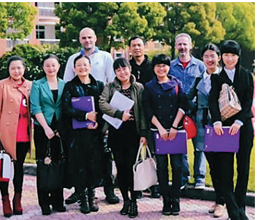
教师们在上海接受培训

A Level 课程原为英国高考课程,现已推广成为国际高中课程。一般要求学生选修三门课程,各门课满分为 A* 等级。获得全 A 等级则能申请英国重点大学。而学生为了申请国际顶尖大学一般会根据需要加修额外课程。