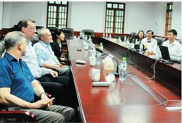
中英两国教师在交流