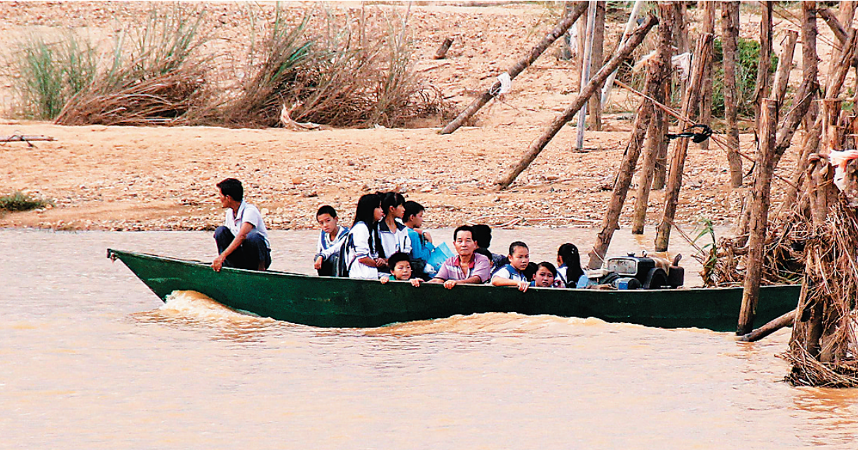
学生乘坐渔船渡江。

去学校。”小婷是留守儿童，平时和爷爷奶奶生活，父母常年在汕头打工。父亲每次在电话里听到女儿这样说心都会揪着，但他也不知道该怎么办。他唯一能想到的办法就是给报社打了个热线电话：“你们能帮帮我吗？孩子这样上学太不安全了，我很担心。”