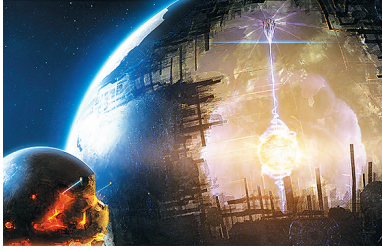
↑ KIC 8462852 周围,会不会有一个正在建造戴森球的高等外星文明?不是没可能,只是可能性极低。

搜寻外星文明研究所天文学家塞思·肖斯塔克说:“天文学历史告诉我们,每当我们以为发现了源自外星生命活动的现象,我们都错了。”不过肖斯塔克也指出,虽然这颗恒星怪异的亮度变化“很有可能”是自然原因而不是外星文明造成的,但谨慎一点核查仍是应该的。