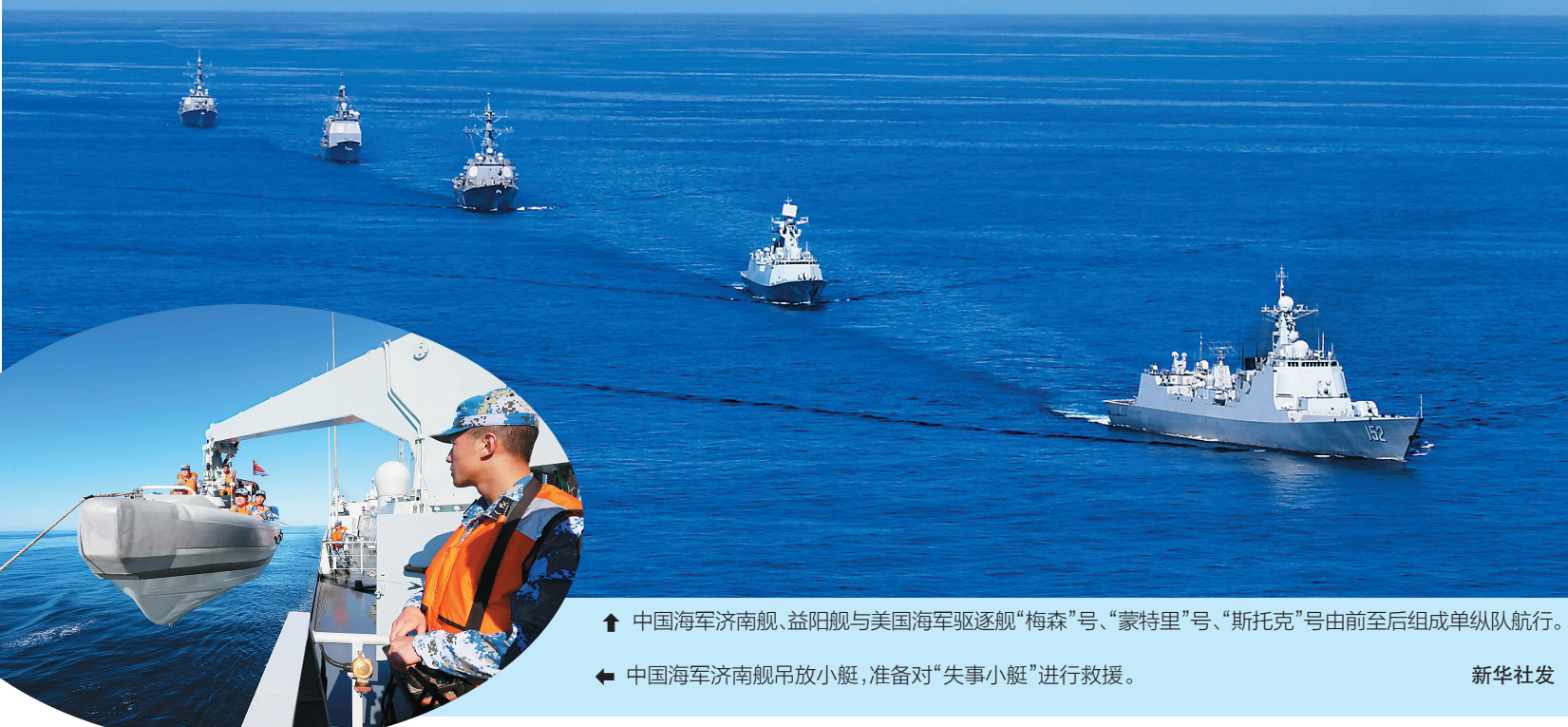
↑ 中国海军济南舰、益阳舰与美国海军驱逐舰“梅森”号、“蒙特里”号、“斯托克”号由前至后组成单纵队航行。