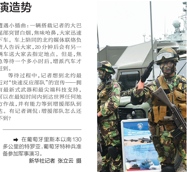
→ 在葡萄牙里斯本以南 130 多公里的特罗亚,葡萄牙特种兵准备参加军事演习。