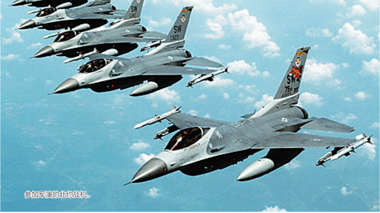
参加军演的北约战机。