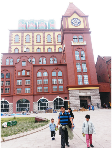
游客在青岛啤酒博物馆参观。

青岛啤酒,中国内地第一家在海外上市的企业;海尔集团,全球家电领军品牌。青岛啤酒博物馆、海尔工业园已经成为青岛工业旅游的主力军。青岛的港口建设、海洋产业发展等领域也走在国内乃至世界前列。 中国海尔,经过30多年创业创新,从一家资不抵债、濒临倒闭的小厂发