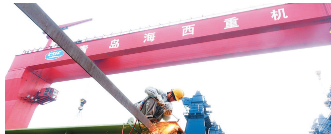
青岛海西重机与海南贸易往来较多。