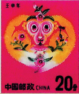
1992壬申年猴票为两枚