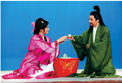
三维立体越剧电影《蝴蝶梦》改编于“庄周试妻”的故事。

字典上对“人性”的解释是:人性是指人所具有的正常的感情和理性。也是一切生命的根本属性。人应该顺应人性,也就是顺应自然,不要轻易地去测试人性。