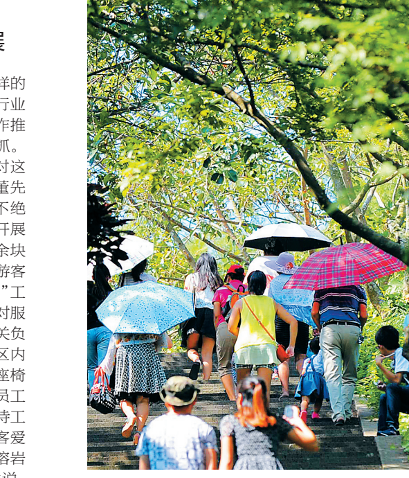
游客在火山口地质公园游览。

“双创”会给旅游行业带来什么样的推动和促进作用，海口许多涉旅游行业都深明其意，因此也都把“双创”当作推动自身行业发展的一项重要工作来抓。 “干净整洁、绿意盎然，这是我对这里的第一印象。”来自重庆的游客董先生对海口火山口地质公园环境赞不绝口。据了解，自海口市“双创”工作开展以来，火山口公园在园区内新增十余块提示标牌，五步设一个垃圾箱，引导游客文明游览，每月进行两次灭“四害”工作。“我们景区以海口‘双创’为契机对服务工作进行了一次提质。”火山口相关负责人说，近期公园在硬件方面对园区内设置的直饮水进行排査消毒，老旧座椅进行加固；在软件服务上，对各部门员工进行培训，要求员工以身作则，在接待工作中，文明用语、微笑服务，倡导游客爱护自然环境，保护火山喷发出来的熔岩等。景区工作人员朱燕深有感触地说：“游客是需要工作人员耐心引导的，景区营造了优美整洁的环境，游客慢慢也会养成好习惯。”