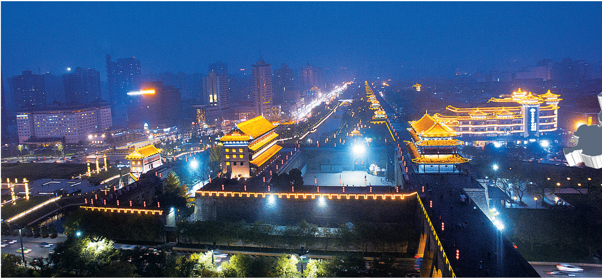
古丝绸之路的起点西安。