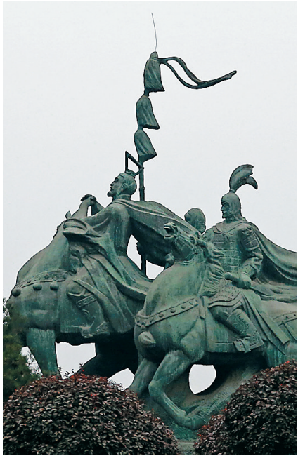
坐落于西安的张骞雕像。