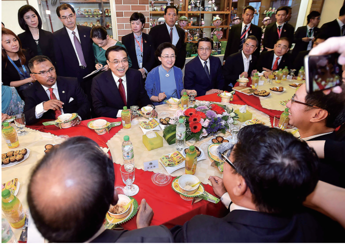
11月22日下午,国务院总理李克强在结束出席东亚合作领导人系列会议一个多小时后,即驱车前往马六甲州,开始他正式访问马来西亚的第一站。李总理夫人程虹陪同访问。这是在三叔公特产店,李克强与19年前访马时结交的老朋友及当地民众代表亲切交流。