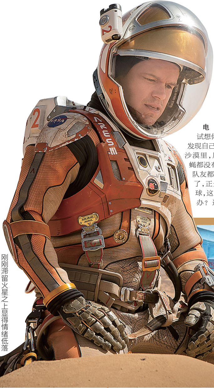
刚刚滞留火星之上显得情绪低落

据新华社电（记者白藏）试想一觉醒来，发现自己躺在火星的沙漠里，周围连只苍蝇都没有，而宇航员队友都以为你“挂”了，正光速飞回地球，这时你该怎么办？这正是好莱坞