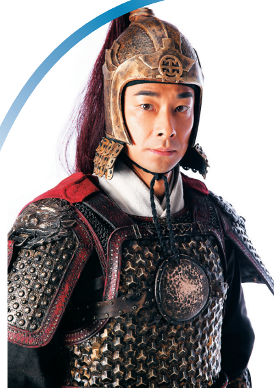
赵文卓《战神戚继光》定妆照