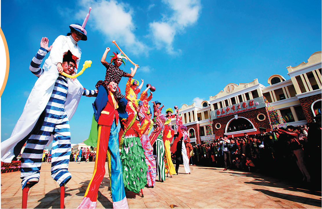
今年的欢乐节仍将有踩高跷等表演。

在开幕式上，德国特罗辛根音乐学院的音乐家们，将演奏霍纳(HOHNER)手风琴和意大利布格里(bugari)手风琴，让欣赏者能够领略世界上最知名与最昂贵的两大手风琴呈现的热情、婉转的琴韵。除了德国手风琴协会的专业演员外，巴伐利亚州民乐队也将在开幕式上带来精彩表演。这支民乐队是保护当地传统民俗文化的优秀典范，他们推广保护民风民俗，保护民间音乐，并致力于传承与传播阿尔卑斯山区民乐。开幕式当天，乐队的艺术家们将用施蒂里亚手风琴、单簧管、铜管乐、中音萨克斯管乐等乐器演绎纯正的欧洲民乐，为观众带来一场音乐大餐。今年是海南省与韩国济州道结好20周年，因此开幕式上除了德国的音乐家外，来自韩国济州道的文艺演出团体也将为观众献上具有韩国民族特色的极富表现力与感染力的精彩表演。