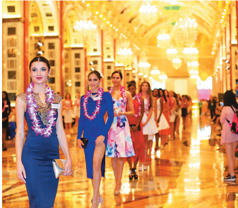
世界小姐总决赛选手在三亚。本报记者 武威 摄

“美女是稀缺资源，美景也是稀缺资源，稀缺资源一定有价值。海南通过赛事活动将两者相结合，充分挖掘美丽文化的内涵，完全可以为海南旅游注入文化的灵魂，让更多的游客来到海南，品读海南。”谢祥项表示，美丽文化作为讲述度假目的地特色的重要抓手，其打造绝非一朝一夕，赛事地标建筑、旅游文化景观带、旅游文化交流基地、长期的旅游文化发展规划制定、系列蜡像馆、博物馆、工艺品等衍生品的深度开发等方面，都需要精心谋划，合理布局。