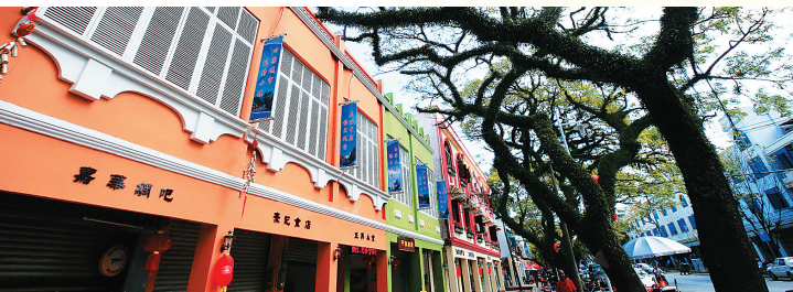
中原镇绿荫街道。

博鳌小镇“老房子”咖啡馆——海边“老房子”咖啡馆——博鳌海的故事主题餐酒吧——中原南洋风情小镇老南洋咖啡馆——嘉积新纪元老嘉积咖啡馆