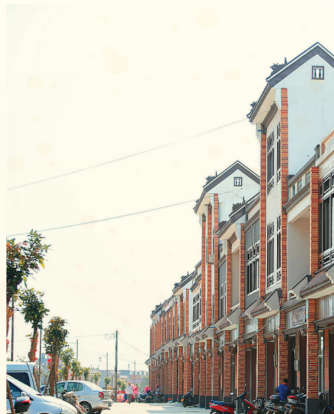
琼海大路街街景。