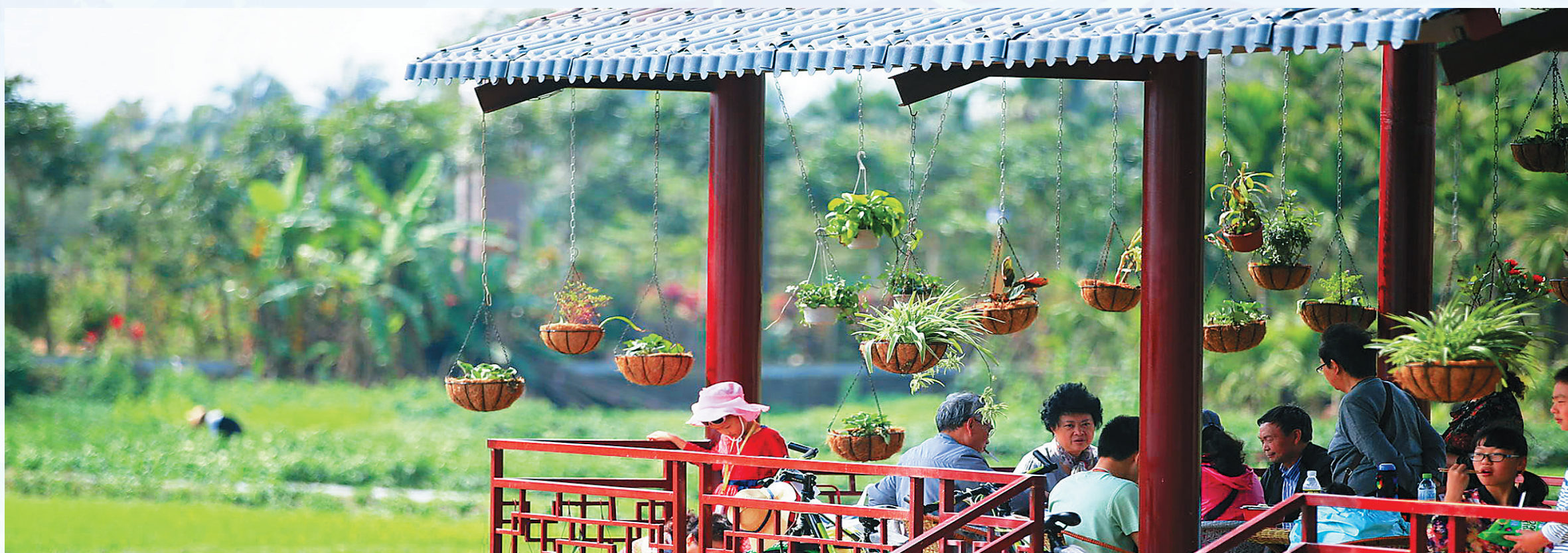
游客在琼海塔洋镇的龙寿洋公园惬意度假。