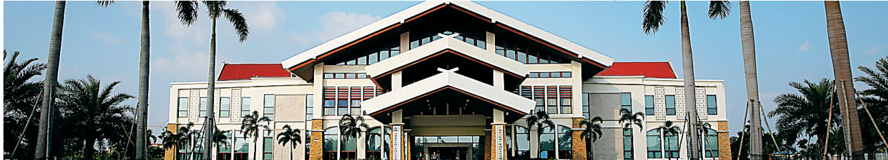
中马钦州产业园区。