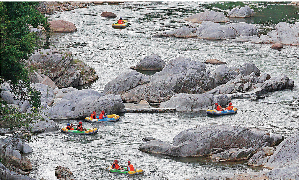
大峡谷漂流。

登山、漂流、骑行、观梯田、赏红叶……置身五指山，你可选择静静的悠闲，沏一杯清茶，呼吸着高负氧离子含量的空气，打发悠闲的时光；你也可以选择动如脱兔，来一场酣畅淋漓的漂流，一次九曲盘旋的山路骑行。