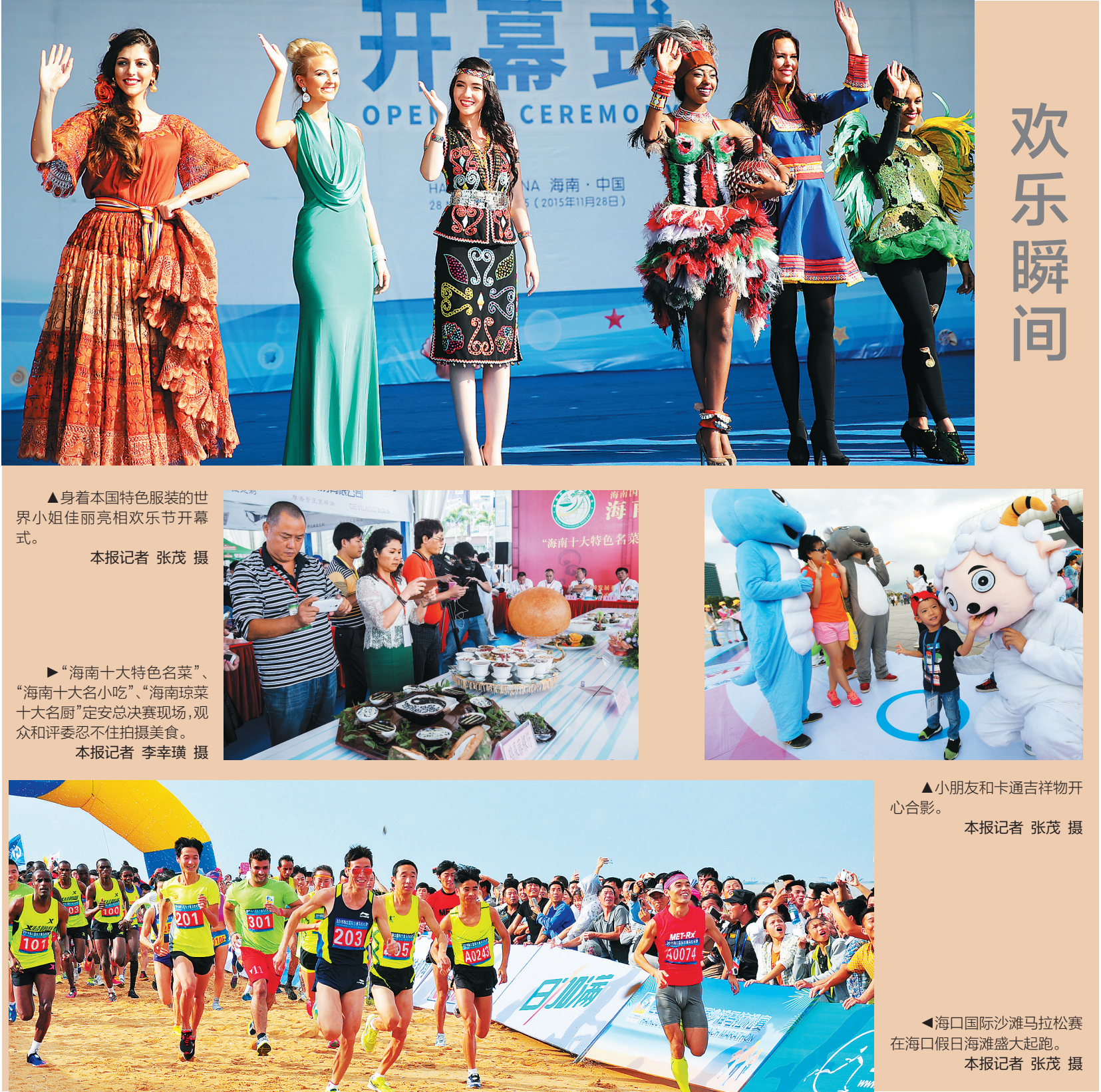
▲身着本国特色服装的世界小姐佳丽亮相欢乐节开幕式。

会上,香岛集团、蟾宫香道会、黎缘居等本土著名沉香品牌悉数登场,推出各种沉香工艺品、沉香园林艺术品、沉香衍生品、沉香文学作品等展品,其中不乏难得一见的沉香极品。