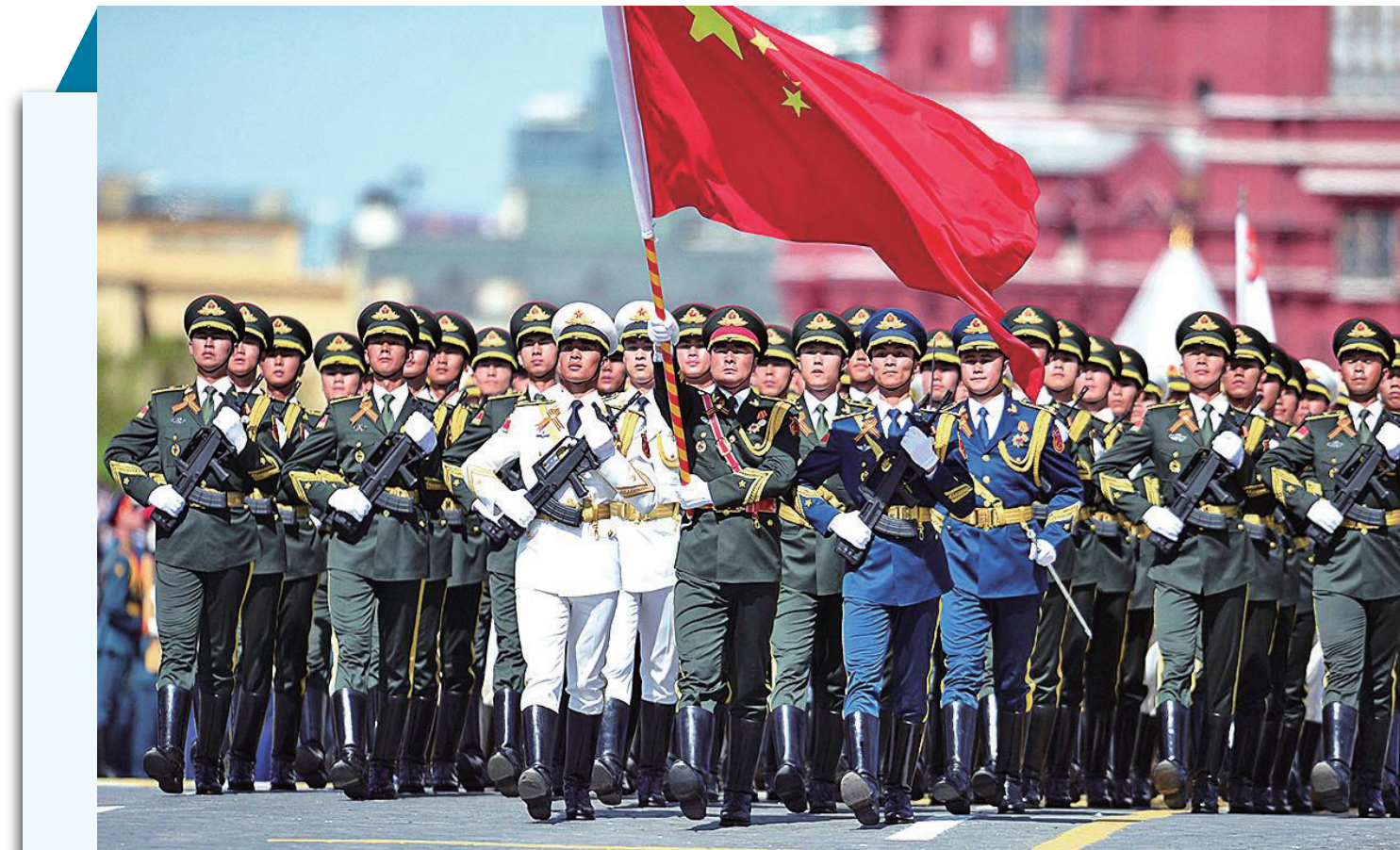
威武的三军仪仗队。

杨宇军:这轮国防和军队改革主要是推进领导管理体制、联合作战指挥体制改革,优化军委机关职能配置和机构设置,完善军兵种领导管理体制;健全军委联合作战指挥机构和战区联合作战指挥体制;优化军队规模结构,落实裁减军队员额30万;改革部队编制,推动部队向充实、合成、多能、灵活方向发展;构建军队院校教育、部队训练实践、军事职业教育三位一体的新型军事人才培养体系;推进军队政策制度改革,重点完善军事人力资源政策制度和后勤政策制度;推动军民融合深度发展,健全相关体制机制;优化武装警察部队力量结构和指挥管理体制等。同时,构建完善中国特色军事法治体系。