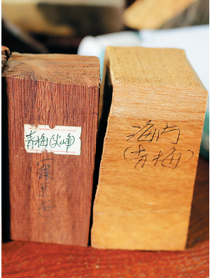
洪少友收藏的青梅格标本。