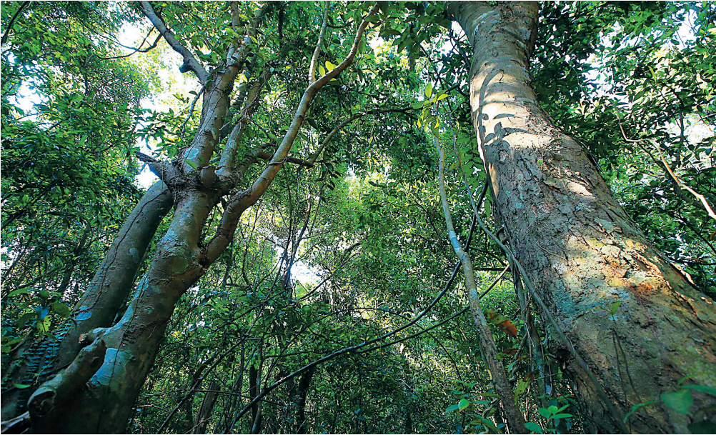
万宁青皮林。青皮又名青梅。