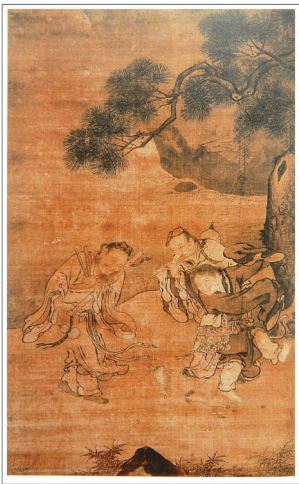
三仙戏蟾图 明代刘俊 绘

彭耜《海琼玉蟾先生事实》谓其“师翠虚陈泥丸先生而学道焉”，这说明白玉蟾是由于陈泥丸先生的接引而步入道门的。陈泥丸即陈楠，金丹派南宗尊为第四代祖师。由于白玉蟾天资聪颖，且有诚笃之心，陈泥丸看重了这个徒弟。于是，白玉蟾“得太乙刀圭之妙，九鼎金丹之书，长生久视之术，紫霄啸命风霆之文，出有人无飞升隐显之法”。