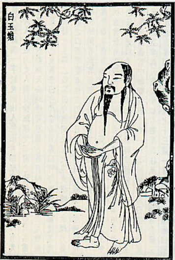
白玉蟾——取自明洪自存《仙佛奇踪》

从嘉定癸酉（1213年）到嘉定壬午（1222年），共计九年时间，这是白玉蟾修道体道时期。他用了九年时间苦修，终于脱胎换骨。对此，彭耜《海琼玉蟾先生事实》有个简短的评论：“按尹子曰：十年死者，十年得道，是得道之速也；百年死