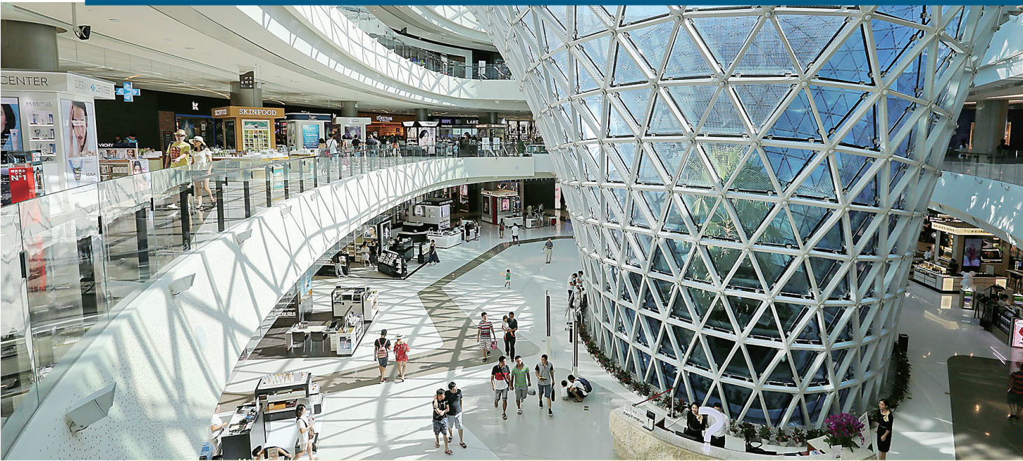
三亚海棠湾免税购物店。