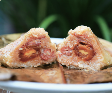
定安肉粽。