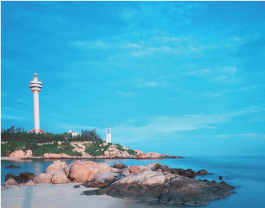
木兰湾灯塔。本报记者 宋国强 摄

自由行推荐： 海南热带野生动植物园—多河文化谷景区—兴隆热带植物园—分界洲岛—南湾猴岛—椰田古寨