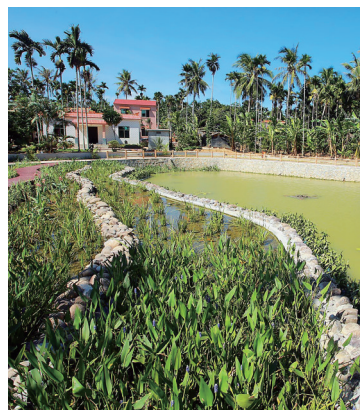
万宁文通村。

作为今年欢乐节的主打活动之一，为期一个月的全省欢乐旅游主题月设计和推出四条主题旅游线路：一是海南欢乐美食游，以在定安举办的海南国际美食博览会为中心，将开设若干条海南美食体验旅游线路，让游客亲身感受海南独具特色的美食文化；二是海南欢乐乡村游，最美乡村，用心去发现，带游客到海南的乡村游览人文风光，品味纯美乡情；三是海南精品景区游，游客在体验海南高端旅游产品的同时，还将享受到超值的景区折扣优惠活动；四是海南欢乐购物游，主打海南购物旅游线路，惊喜的促销打折活动，给游客带来快乐的购物体验。