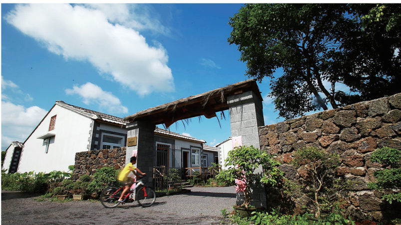
乡村民宿。

人留下回忆，这种回忆或许是主人烧的一手好菜，或许是主人叙述的一个又一个有趣的旅居故事，或许是主人偶然间的吹拉弹唱、信手涂鸦，或许仅仅就是室内的装饰、架上的书籍、门口的小狗。