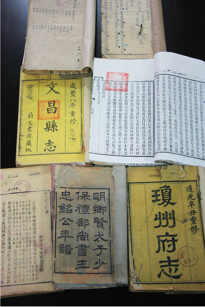
海南师范大学图书馆珍藏的部分海南古籍。

海南大学图书馆馆员李景芝老师介绍,此书正文共一百六十卷,分《正朝廷》、《正百官》、《固邦本》、《制国用》、《明礼乐》、《秩祭祀》、《崇教化》、《备规制》、《慎刑宪》、《严武备》、《驭夷狄》、《成功