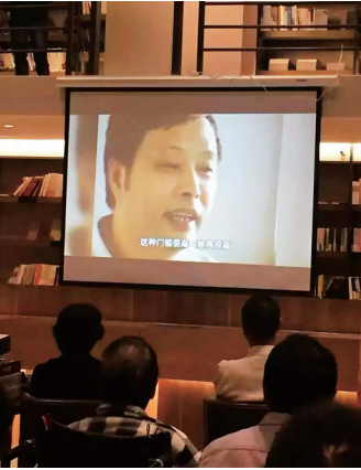
读者在签售现场观看《天涯》纪录片。

而改版后的首任主编蒋子丹则对坊间有关她一开始拒绝韩少功的邀请的传言做了纠正。她正式的修订版本是:一开始接到韩少功的邀请时很犹豫。经过深思熟虑,她决定接手做《天涯》的主编。做一本杂志的主编,意味着时间和精力的双重投入。而当时,蒋子丹正是中国炙手可热的女作家,写作正是