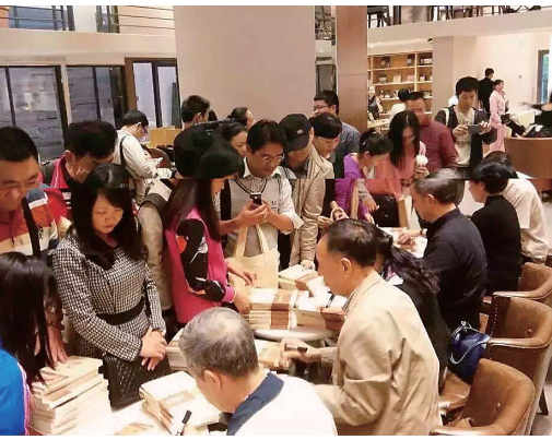
《天涯》二十年精选丛书签售现场火爆

《天涯》二十年精选丛书发布会后,举行了签名售书活动,场面火爆,让人振奋。仿佛海南岛的文化沙龙时代已经来临。