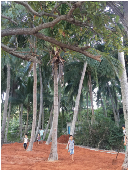
村中儿童在椰树下玩耍。南湾村正在平整这里的土地,计划打造一个公共休闲场所。