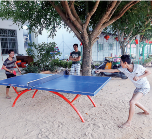
南湾村村民在树下打乒乓球。