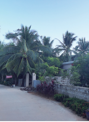
南湾村林木繁茂,几乎把民居遮蔽,如桃源般深幽美丽。

“我们可打造家庭旅馆,也可以和景区合作,打造休闲公园。”展望前景,许明新不少思路。 尽管公司还没什么动静,但合作企业已经许诺,会让村民住上好房子,过上好生活。许明新说,企业还给村民买了两辆电瓶车,村民去渡口,就可以坐它们…… 暮色中的南湾村,山色冥冥,海风徐徐,浸透了整个村庄。守着猴岛这么多年,南湾人似乎终于可以做一番新梦了。