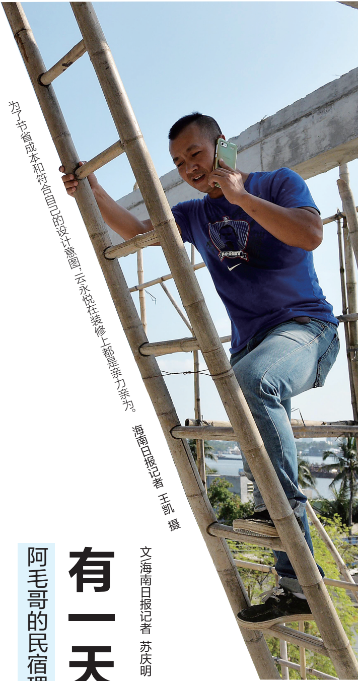
为了节省成本和节省时间，因为设计意图，所以选择在装修上都是亲力亲为。