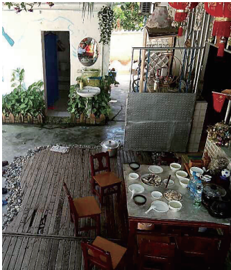
阿毛哥初次开的客栈“南洋兄弟”。