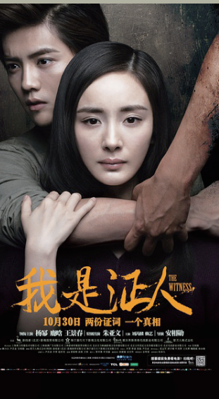
《我是证人》本年度最具话题热度的悬疑推理片