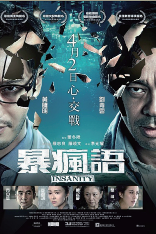
《暴疯语》是一幕人与自我斗争的心理大战