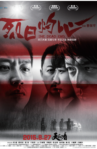
过亿之作《烈日灼心》

2015年“黑马”辈出的电影类型非《捉妖记》等喜剧莫属,背负骂名最多的是《小时代4》为代表的青春片。悬疑推理片作为颇具观众缘的一群。虽然未能称霸江湖,但绝对是商业电影中一支劲旅。其扑朔迷离的烧脑情节,峰回路转的猜谜游戏,黑暗世界中各种力量的角逐,让很多观众学会思考的同时大呼过瘾。