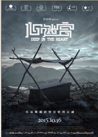
《心迷宫》,取材于农村现实生活的悬疑推理片