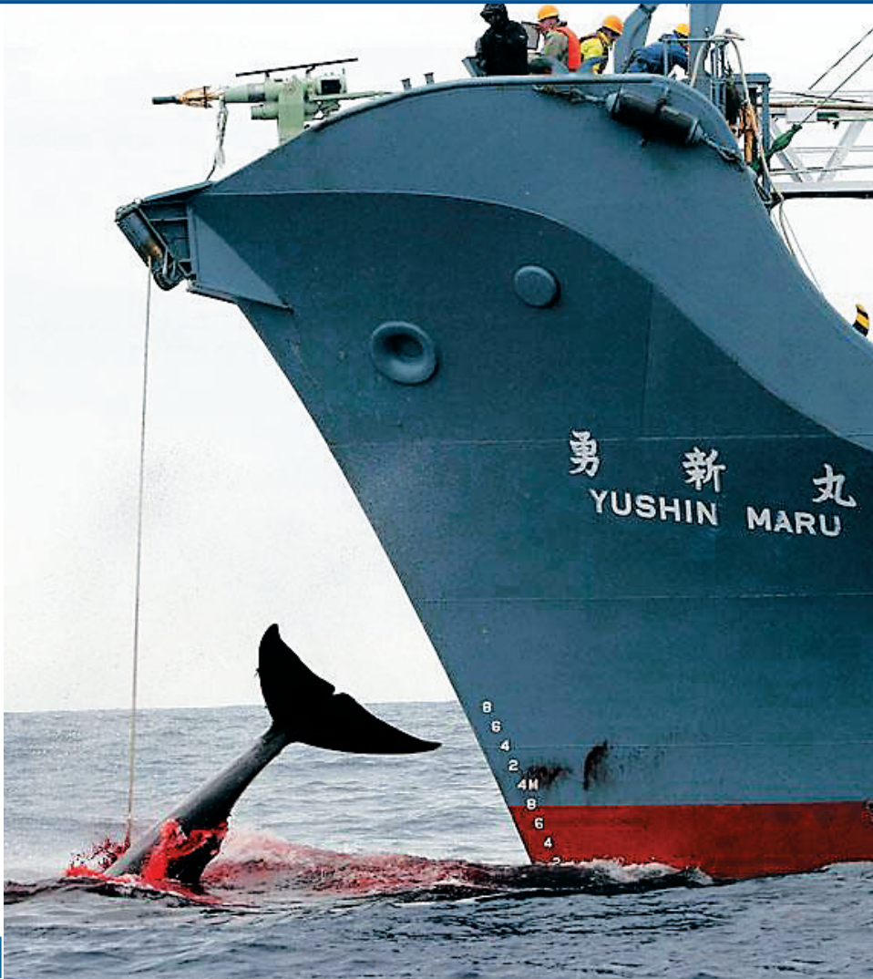
→这张拍摄于2006年1月7日的资料照片显示了日本捕鲸船在南太平洋海域捕鲸的场面。

的捕杀范围,导致今后12年将有近4000头鲸遭屠戮。 曾多次在南太平洋海域阻扰日本捕鲸船的海洋守护者协会已经表示,将继续派船跟踪日本捕鲸船并阻止其猎杀鲸。 闫洁(特稿·新华国际客户端)