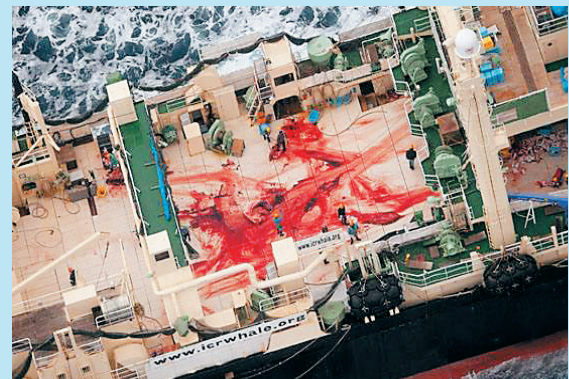
↑日本捕鲸船上的工人肢解完四条濒危的小须鲸之后,鲜血染红了甲板(2014年1月5日摄)。