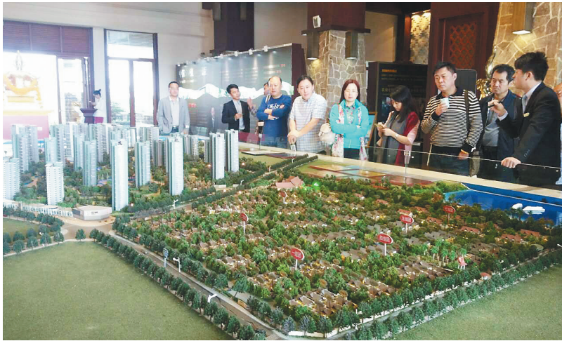
省报代表团考察文昌市高龙湾1号项目。

启动“中国省级党报大数据营销联盟平台”,有效整合了各省资源,充分实现了跨地域深度合作;省级党报在当地乃至全国有着极强的公信力,党报联盟为海南地产做推介,不仅给各省人民在海南置业提供了一个权威、放心的平台,也全方位展示了海南旅游地产文化的精髓和内涵,为海南楼市增添了活力和正能量。 全国多家省级党报联手营销海南地产,得到了参会党报代表的积极响应。据了解,作为党报联盟重要成员,大众日报组织的首批看房团共10余人将于12月下旬飞抵海南。甘肃日报拟与海南日报合作,在兰州设立海南房地产展销大厅,并建成大数据营销平台,通过线上媒体宣传和线下推介活动,不定期组织购房团,包机飞琼团购。