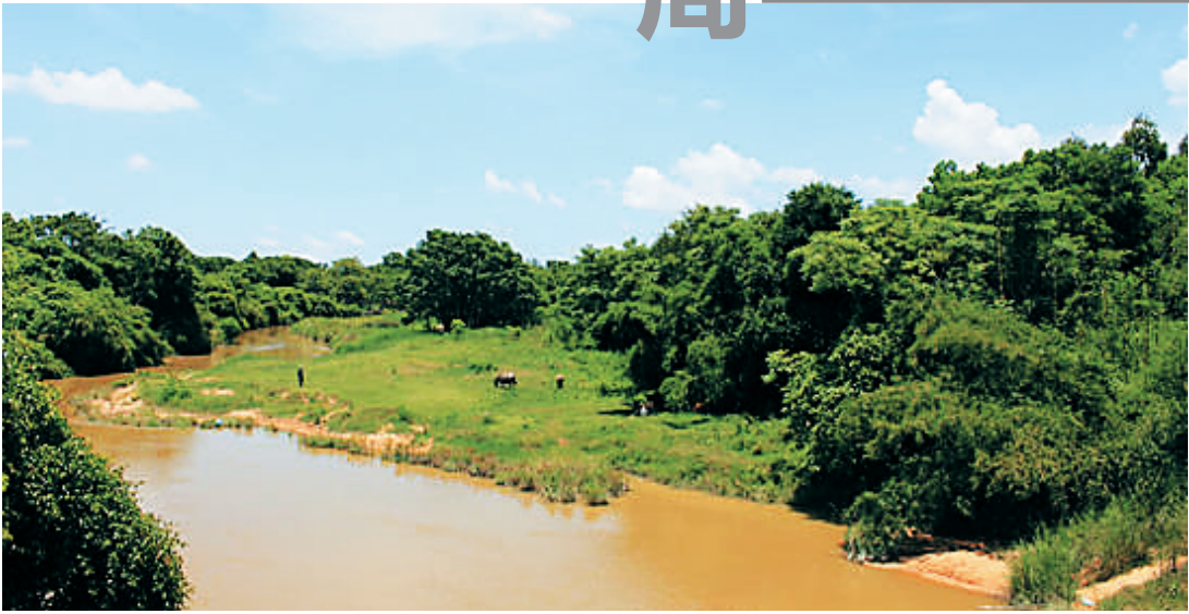
流经定安潭榄村的潭榄溪。

“吾家之谱，迨本溯源，由来传自唐时河南光州府固始县洽公，登长庆甲辰进士，官枢密院副使，于闽闾十八世，仕宦弗绝，迄南宋时唯冠公迁福清县六十一都缙山下村，生春、月、霜、寅四公。春仍居福建，月居临高之多文，霜为大理寺评事，因抗疏谪琼，莅澄迈县尹，吾太祖寅公随霜公谪琼……”《吴氏族谱》这篇《续修家乘序》，基本交代了这一宗族的来源，以及迁琼之初吴月、吴霜、吴寅三兄弟的落籍之所。 此后，三兄弟的后人又陆续散居海南多地，其中以琼山、定安为主。 翻阅清代和民国多次续修和重修的定安“世德堂”《吴氏族谱》，方知这一家族在明代人才辈出，200年间以举人身份进入仕途者众多，贡生更是举不胜举，可谓科举世家，而广西宾州知州吴孟侏，只是其中的一位“有故事”的举人。 30年前续修的至德堂《吴氏族谱》，保留了大量的历史文献，后人借此不但可以窥见一个家族的简史，也能够知晓各个家族之间和同时代官宦之间的社会关系。