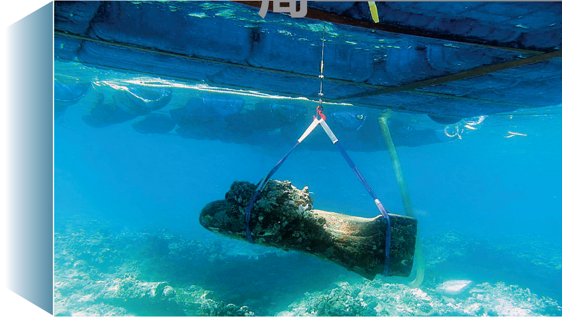
◀2015年4月,考古工作者打捞西沙群岛“珊瑚岛一号”沉船遗址的石构件。

论坛期间,新加坡、菲律宾、泰国、缅甸、柬埔寨、老挝、英国、肯尼亚等国家及国内部分省份的代表争相发言,就海上丝绸之路文化遗产保护工作开展交流探讨,纷纷向海南伸出了共同研究、共同发展的橄榄枝。