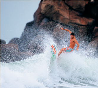
海南万宁国际冲浪节冲浪精英邀请赛上冲浪选手雄姿。