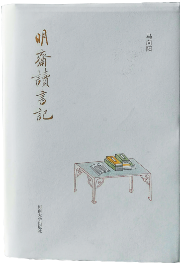
马向阳新作《明斋读书记》。

您独特的视角与观点，令人获益非浅。阅读这些名人著作，对您的写作以及文风的形成，有着怎样的影响？