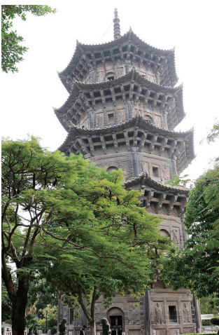
泉州千年导航石塔。

今天,在国家“一带一路”战略机遇下,海南与泉州都面临着再出发的机遇,如何发挥历史优势、拥抱时代机遇、找准地域定位、谋求发展跨越,成为了摆在海南与泉州面前极为紧迫的机遇与挑战。