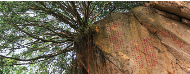
九日山上的折风石刻群,记载了泉州作为海上丝绸之路起点的史绩。

鉴古而知今。纵观泉州历史,因开放而兴,如今有了“一带一路”战略,泉州再次走向了建设海上丝绸之路先行区的历史前沿。对于同样是资源、市场两头在外的海南而言,泉州对海南最大的借鉴意义就是要坚定不移地坚持改革发展、扩大开放合作,这也是海南科学发展、绿色崛起根本之所在。加强城市港口建设、打造海上丝绸之路战略支点,更需要海南扩大对外开放,不断增进与海上丝绸之路沿线国家、地区间的经贸合作和人文交流,大力发展外向型经济,主动服务于“一带一路”国家战略。