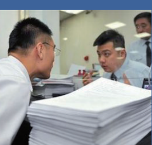
立案登记制将更多的社会矛盾纳入法治渠道解决