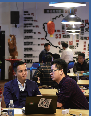
大众齐创业 共筑中国梦