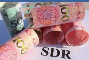
人民币被世界正式认可为国际货币