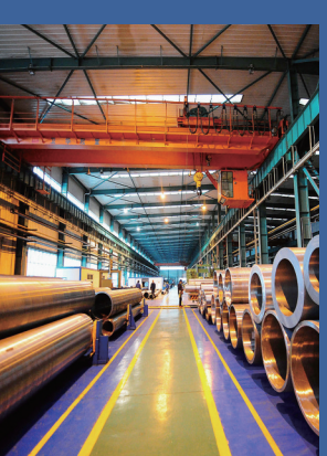
中国制造将催生一场“新工业革命”