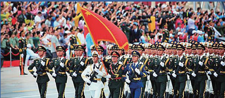
纪念抗战胜利70周年大阅兵