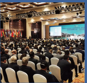
第二届世界互联网大会 开创互联网新时代