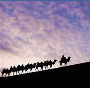
一带一路造福各国人民