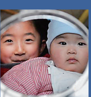
稳妥迎接“二孩时代”