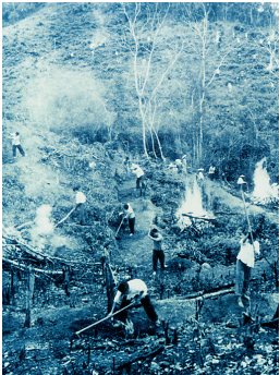
海南“一五”时期,主要集中在种植橡胶为主的农垦事业和铁矿石开采。图为当年大开荒种橡胶的场面。

2015年末,海南正总结“十二五规划”,抓紧编制“十三五规划”。查找60年前的“一五计划”,对比今天,海南已经发生了翻天覆地的变化。