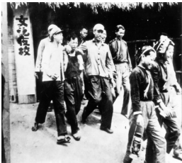
1956年3月上旬,扫盲运动在全区开展。19万农民入夜校学习。图为中瑞农场文化夜校一景。