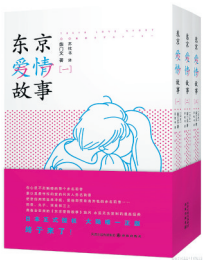
《东京爱情故事》漫画套装

生于1970年代,成长1990年代的我们,其实每一个人心里都活着一个赤名莉香,她让我们第一次知道,两性之间的爱,可以如此的简单热烈,可以如此的不计后果。■