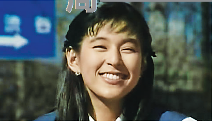
电视剧《东京爱情故事》中的女主角赤名莉香

赤名莉香是一九七零年代出生的部分中国男生的情商启蒙者,可以这样说,作为一个七零后的男人,如果不给赤名莉香写一封信件,那么,我们的青春期永远不会结束。 因为同名电视剧《东京爱情故事》的热播,四角恋爱故事取代了旧有的三角恋爱叙事模式,成为当年火热的情感话题。对于成长在上世纪八十年代的中国男生,这样的故事如同一味感情的芥菜,直接打开我们封闭而陈旧的感官和两性观念,使我们瞬间中了赤名莉香的毒。 今年8月,译林出版了原著柴门文的漫画套装,三本。