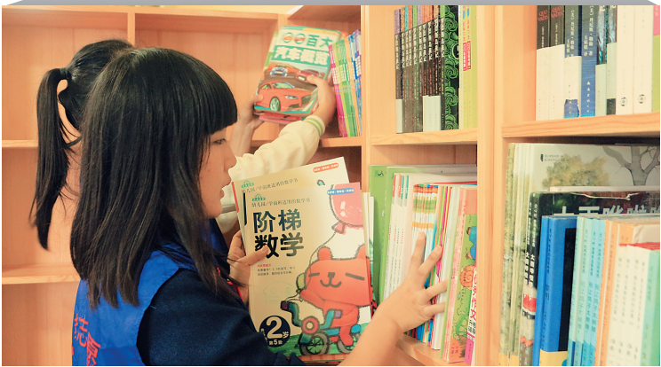
海南师范大学文学院青年志愿者协会的“稻草人”爱心服务队七年坚持到流动子女学校海口市美兰区五一小学，帮助建书屋，与孩子们交流。