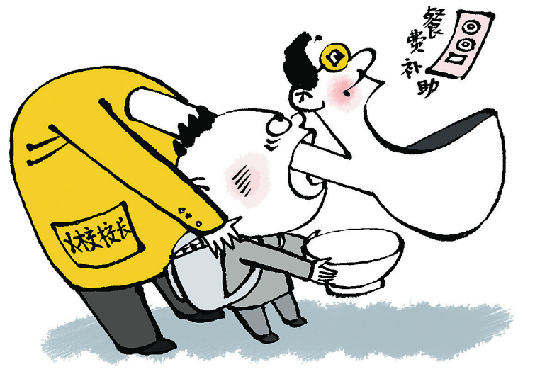
图时 贪无人道应重判

和官员盲目追求短期效益，违背城市发展规律，“长官意志”挂帅，把“以人为本”变成了“以个别人为决策核心”，将民意求之高阁或当成可有可无的“花瓶”，“拍脑门”决策、“拍屁股”走人现象时有发生。一些城市主政者的“大手笔”变成“大败笔”，有的项目还滋生腐败，耗费大量人力物力财力，群众对此反映强烈。 城市规划、建设工作是一个系统工程，牵涉面广，涉及利益多元，稍有不慎，就会损害政府公信力。做好城市工作，必须坚持以人为本的发展理念。现阶段，尤其需要统筹政府、社会、市民三大主体，提高各方推动城市发展的积极性，尽最大可能推动政府、社会、市民同心行动，使政府有形之手、市场无形之手、市民勤劳之手同向发力。 一个城市的发展，需要政府持续不断的努力，更需要社会和市民的广泛参与。市民是城市的主人，城市发展必须符合广大市民的根本利益。限行、限购等城市发展的重大决策，关乎市民切身利益，应该充分尊重民意、用好民智。越是关乎城市发展的重大民生决策，政府部门越是需要遵循程序正义和法治精神，依法行政民主决策，积极创造条件让市民和全社会为城市建设和治理贡献力量。(张建 姜伟超)