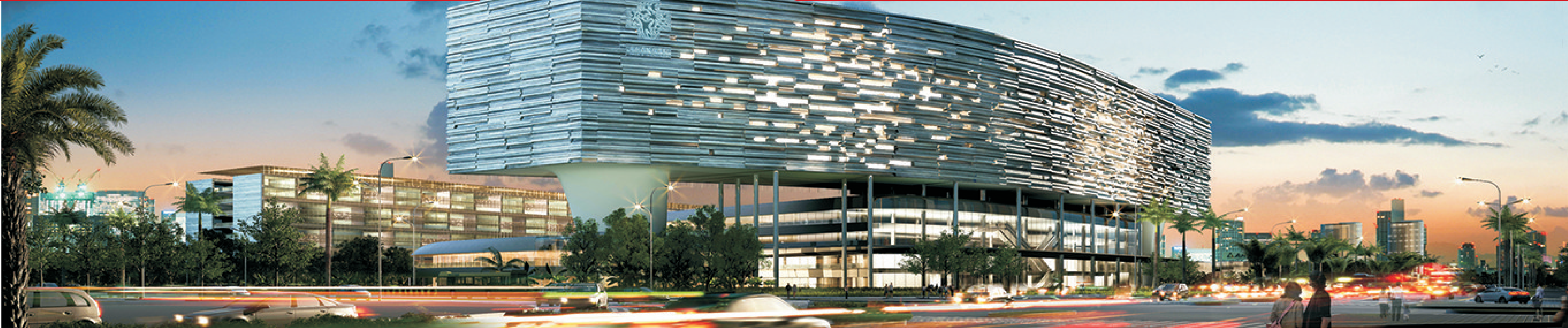
海南省肿瘤医院效果图。