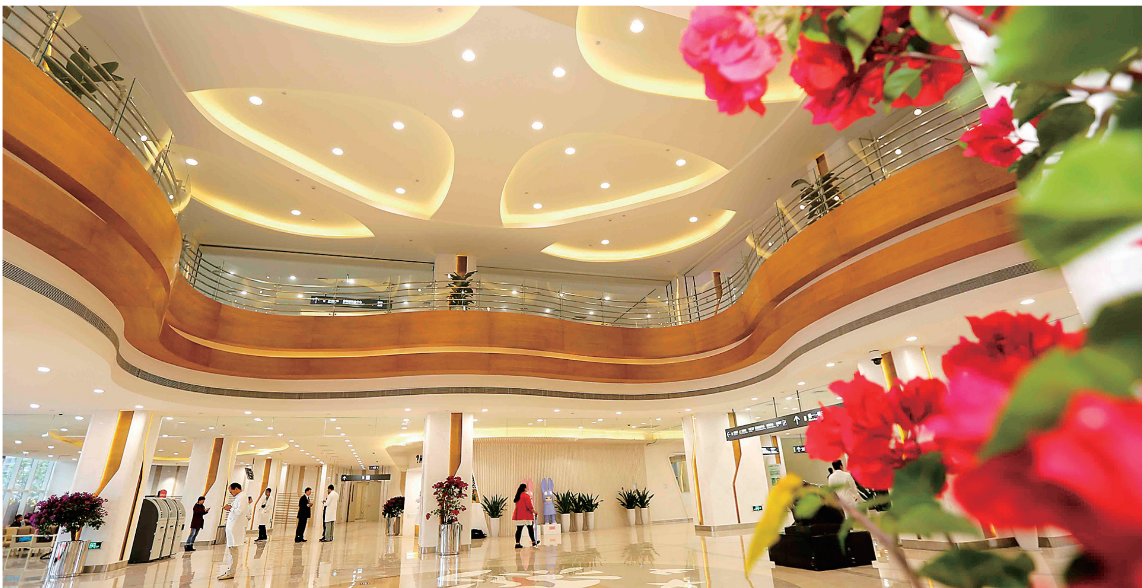
一楼大厅。本报记者 陈元才 摄(本版图片除署名外均为资料图)

海南省肿瘤医院(简称院医)按三级甲等肿瘤专科医院标准设计建设,开业填补了海南省没有肿瘤专科医院的空白,成为海南省最高肿瘤防治机构和一家集医疗、康复、预防、教学和科研为一体的新型现代化医院。 医院与中国肿瘤学科的发祥地天津市肿瘤医院建立了全面战略合作关系,共建海南省肿瘤医院暨天津市肿瘤医院海南分院。 医院已列为海南省委、省政府2015年为民办实事十大事项和海南省、海口市共建重点工程项目。 医院设计病床1200张,设计年门诊量45万人次,收治病人2万例,手术1.2万例。 医院位于海口市长流起步区,占地面积10.39万平方米(156亩),建筑面积23万平方米,一期17.5万平方米,总投资22亿元人民币。 医院于2013年10月正式开工建设,2014年10月主楼封顶,截止到2015年2月底,已完成投资约12亿元,2015年12月25日建成开诊。 医院由国际知名的美国坤龙建筑设计公司设计,建筑设计简洁美观,医疗功能布局合理、流程便捷,设有洁净手术室、ICU、检验、病理、核医学、放疗等医疗功能区,在门诊、住院等公共建筑空间和各项服务设施的设计上都体现了较先进的人文理念。 医院设有11个临床科室和14个医技科室,拥有完善的肿瘤专业学科体系,其中肺癌、鼻咽癌、乳腺癌、腹部肿瘤、妇科肿瘤为其重点专业。医院作为海南省最高肿瘤疾病防治机构,在肿瘤流行病学和肿瘤临床科研方面也将发挥重要作用。 医院拥有正电子断层扫描机、磁共振CT、直线加速器以及肿瘤实验室检测仪器等各类先进的肿瘤诊断、治疗设备1400余台套,价值4亿多元人民币,完全满足诊断、治疗、康复等临床需求。 医院按照国际电子病历评级HISMM6标准建设信息系统,构建数字化、无纸化医院,为医院管理、临床医疗提供最便捷的服务。 医院在医疗质量控制及管理方面,启动了代表医疗质量及医院管理最高水平的JCI认证工作,为患者提供最贴心的服务,增强患者体验,真正做到以患者为中心来组织相关资源,进而提高医院品牌的知名度和美誉度,为医院走向国际市场、参与国际竞争打下了坚实的基础。 医院在全国以及世界范围内开展了人才引进工作,聘请了一流的学科带头人作为科室主任,以专业发展专业,构建可持续发展的专业系统。同时,医院提前一年招聘了200多名医护人员,安排在天津市肿瘤医院进修学习,以保障开院后正常运行。 今后,医院将以现代的建筑、先进的设备、一流的技术和管理,为海南人民和全国人民提供高品质的医疗服务。