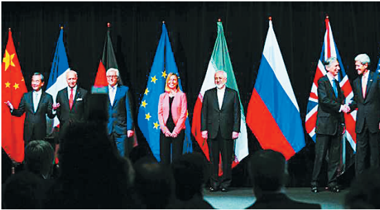
7月14日,伊朗核问题达成了历史性协议。

7月14日,伊朗核问题六国(美国、英国、法国、俄罗斯、中国和德国)与伊朗达成全面解决伊朗核问题的历史性协议,为解决延续了12年的伊朗核问题达成了政治共识。协议包括解除对伊朗制裁及其行动计划、核技术合作、对协议实施的监控、对伊朗核能力设限等关键内容。10月18日,伊朗核问题协议《共同全面行动计划》生效,美欧开始解除相关对伊制裁。伊核问题全面协议最重要的成果是维护了国际核不扩散体系,伊朗方面作出不发展核武器的政治承诺,各方以有约束力的国际协议方式将这一承诺固定下来,同时给予伊方和平利用核能的正当权利,伊与各方的关系也翻开新篇章,有助于中东地区的和平与稳定。全面协议的重要启示是坚持政治解决方向,为国际社会提供了通过对话协商解决重大争端的有益借鉴。作为伊核谈判的坚定支持者和建设性参与方,中国在伊核问题上的主张以及在关键时候展现的斡旋智慧,为协议的达成作出了独特贡献。