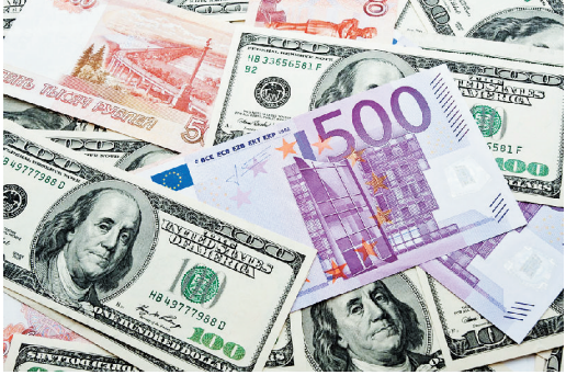
12月16日,美联储宣布9年多来的首次加息决定。

今年,国际金融危机深层次影响还在继续,世界经济仍然处在深度调整期。究其根本,上一轮科技和产业革命所提供的动能已经接近尾声,传统经济体制和发展模式的潜能趋于消退。同时,发展不平衡问题远未解决,现有经济治理机制和架构的缺陷逐渐显现。这些因素导致世界经济整体动力不足,有效需求不振,复苏仍需时日。12月16日,美联储宣布9年多来的首次加息决定,将联邦基金利率上调25个基点到0.25%至0.5%的区间。此次加息对其他经济体,尤其是对新兴经济体有何外溢效应,有待观察。在全球经济疲弱的背景下,中国经济虽面临下行压力,但长期向好的基本面未变,对世界经济增长的贡献率仍在30%以上,仍是世界经济重要动力源。中国有信心、有能力保持经济中高速增长,继续为各国发展创造机遇。