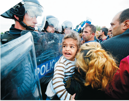
9月19日,斯洛文尼亚防暴警察阻挡试图入境的难民。

自今年年初起,100多万名西亚北非难民疯狂涌入欧洲,数千难民在逃难途中不幸葬身地中海。这场自二战以来规模最大的难民危机对欧洲形成严重冲击,相关国家就难民安置问题争执不下,相互推诿。难民潮正持续冲击着欧洲的政治生态和社会稳定,更拷问着“欧洲和欧盟精神”。战乱和贫困是导致此次难民潮的主要因素,是为人祸而非天灾。美国 and 欧洲大国主导以武力推翻伊拉克、利比亚等地区国家原有政权,不断策动叙利亚反对派进行内战,试图改变相关国家的政权和政治社会制度,导致该地区既有秩序被打破,战乱不断、动荡持续,再加上极端组织“伊斯兰国”坐大肆虐,大批民众被迫逃难,深切体会到了“颜色革命”之恶、“普世价值”之伪、丧失主权之痛、战争动乱之害。