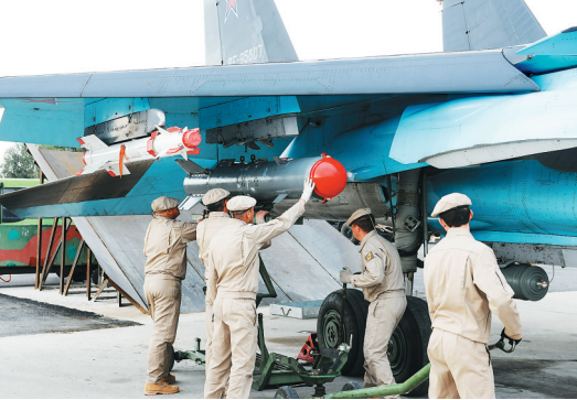
12月16日,在叙利亚拉塔基亚省赫梅明空军基地,一架苏-34战斗轰炸机正在装载导弹,准备起飞打击IS目标。

1月7日,法国巴黎《查理周刊》遭恐袭。10月31日,俄罗斯一架客机在埃及遭恐袭坠毁,机上224人丧生。11月13日,巴黎发生系列恐袭事件,造成至少130人死亡。11月20日,马里首都巴马科发生恐袭事件,造成包括3名中国公民在内的20人死亡。“伊斯兰国”(IS)声明对多起事件负责,该组织不断坐大引起全球关注。恐怖袭击频发使国际安全局势骤然紧张,各国加大反恐力度,谋求反恐合作。9月30日,应叙利亚总统巴沙尔请求,俄罗斯开始对叙境内的IS实施空中打击。巴黎系列恐袭事件后,法国、俄罗斯、美国、德国等谋求加强合作,发动密集军事行动打击IS。11月20日,联合国安理会一致通过决议,以最强烈言辞谴责IS制造恐怖袭击,呼吁国际社会“采取一切必要措施”打击恐怖主义。