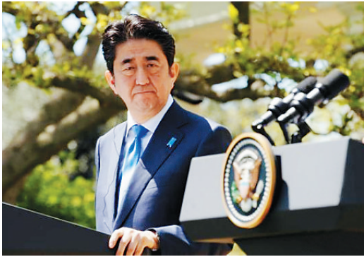
日本只有正视和深刻反省历史,才能真正走向未来。

8月14日,日本首相安倍晋三发表所谓战后70周年谈话,仅以回顾历届内阁历史认识立场的方式间接提及“殖民统治”“侵略”“反省”“道歉”,并宣称战后出生的日本人不应该背负“谢罪的宿命”。“安倍谈话”缺乏诚意,与“村山谈话”的精神渐行渐远,将其修正史观暴露无遗。9月19日,日本执政联盟控制的国会参议院全体会议不顾在野党强烈反对及民众大规模抗议,强行表决通过了以解禁集体自卫权为主要内容的新安保法案。这是二战结束以来日本安保政策的最重大转折,实质性改变了日本宪法第九条规定的“专守防卫”政策,意味着日本向“修改和平宪法”的目标又迈进了一步。国际社会认为,日本只有正视和深刻反省历史,坚持走和平发展道路,才能避免历史重演,才能真正走向未来。现今日本政府所做的一切与此背道而驰,国际社会不得不高度警惕。