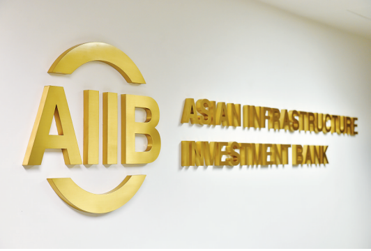
亚洲基础设施投资银行的标识。

6月29日,57个意向创始成员国代表签署《亚洲基础设施投资银行协定》,中国是现阶段亚投行第一大股东和投票权占比最高的国家。11月30日,国际货币基金组织(IMF)批准人民币加入SDR货币篮子,人民币将成为可自由使用货币,与美元、欧元、日元和英镑一起构成SDR货币篮子,人民币将占10.92%的权重,排第三位。12月18日,美国国会批准IMF改革方案,中国在IMF的投票权占比将升至第3位,印度、俄罗斯和巴西的份额都将跻身前十名,新兴市场话语权大幅提升。这表明,以中国为代表的新兴市场国家将更多参与全球金融体系改革和发展,有助于消除当前国际金融体系的内在缺陷和系统性风险,为世界金融稳定和经济发展注入新活力。