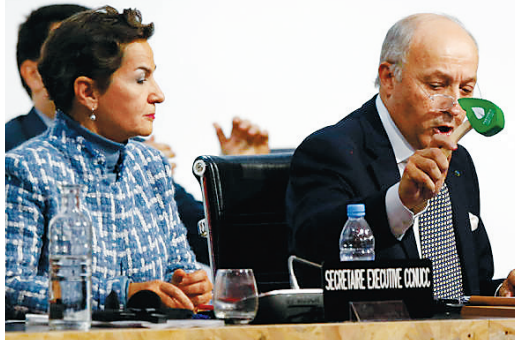
12月12日,法国外交部长、巴黎气候变化大会主席法比尤斯在巴黎气候变化大会上落锤,标志着巴黎气候协议的达成。

联合国气候变化巴黎大会11月30日至12月12日举行,约150个国家的领导人出席开幕活动,中国国家主席习近平在大会开幕式上发表了重要讲话,为巴黎协议谈判提供了强大的政治驱动力。作为发展中国家和世界第二大经济体,中国坚持“共同但有区别责任”原则,一直是全球应对气候变化事业的积极参与者,赢得了国际社会的广泛赞誉。12月12日,气候变化巴黎大会通过《巴黎协定》,为2020年后全球应对气候变化行动作出安排。根据协定,各方将以自主贡献的方式参与全球应对气候变化行动。各方将加强对气候变化威胁的全球应对,把全球平均气温较工业化前水平升温控制在2摄氏度以内,并为把升温控制在1.5摄氏度以内而努力。