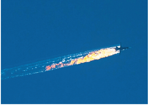
11月24日,俄罗斯战机执行反恐任务途中被土耳其军机击落。

11月24日,俄罗斯一架战机执行反恐任务途中被土耳其军机击落。俄方称土方是“背后捅刀”。由此,两国关系骤然恶化,双方针锋相对,频频过招,局势一时紧张。土方击落俄战机事件为俄扩大在中东地区的军事和政治影响提供了机会。11月26日,法俄领导人表示要协调行动,在叙利亚有效打击恐怖主义。美国也转而寻求与俄就反恐问题进行合作。12月15日,美国国务卿克里表示,美国及其盟友当前并不追求改变叙利亚政权,但巴沙尔·阿萨德未来不应继续执掌叙利亚政权,必须努力推动解决叙利亚问题的政治进程。12月18日,联合国安理会就政治解决叙利亚问题一致通过决议,将力争明年初启动叙利亚各派正式和谈。大国在中东地区的地缘政治博弈出现新局面。