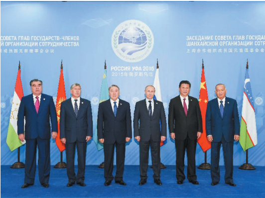
7月10日,上海合作组织成员国元首理事会第十五次会议在俄罗斯乌法举行。这是会前,成员国元首集体合影。

2015年,中国特色大国外交全方位发力,积极推进构建以合作共赢为核心的新型国际关系,打造人类命运共同体。习近平主席8次出访,积极推进周边命运共同体建设,构建健康稳定的大国关系框架,巩固同发展中国家的团结合作。中国步入多边外交舞台的中心,习近平主席先后出席上海合作组织峰会、金砖国家峰会、联合国成立70周年系列峰会等。中国全面推进“一带一路”建设,加强与沿线各国的政策对接和互利合作。这一系列外交活动展现了中国的和平发展道路与大国责任担当。习近平主席在出访中发表了一系列重要讲话,提出了一系列中国外交的观点、理念、主张,展现出鲜明的中国特色、中国风格、中国气派,赢得全世界广泛关注和强烈反响。