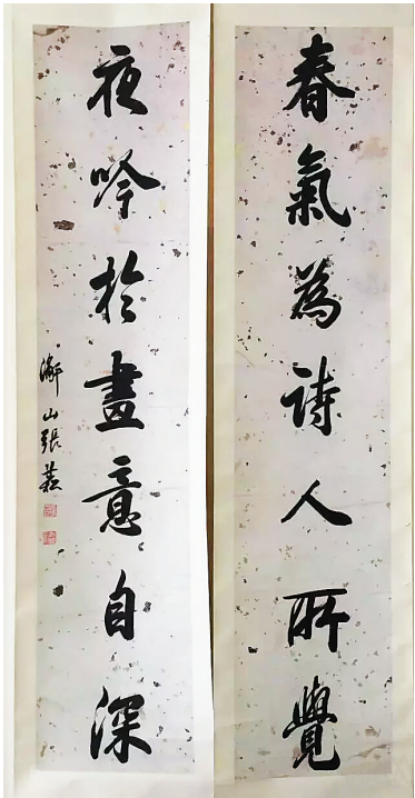
白海收藏的张岳崧对联