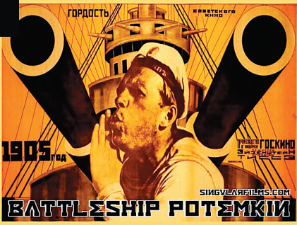
《战舰波将金号》以丰富的蒙太奇手法为世界电影爱好者顶礼膜拜