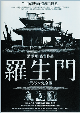
日本导演黑泽明名作《罗生门》