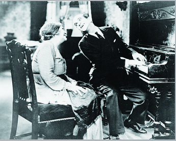
1927年《爵士歌王》中男主角无意中留下的几句台词叩开了电影有声化的大门