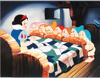
《白雪公主和七个小矮人》