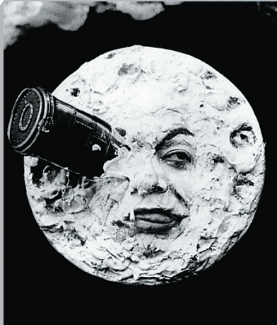
1902年的《月球旅行记》，让白日做梦成为可能