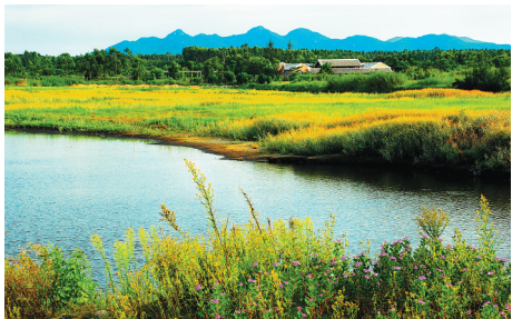
昌江湿地风光。