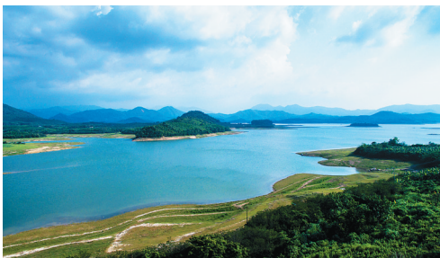
昌江石碌水库。