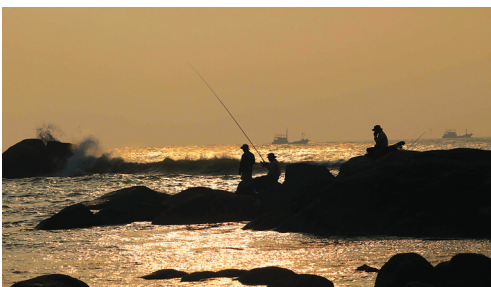
昌江棋子湾。