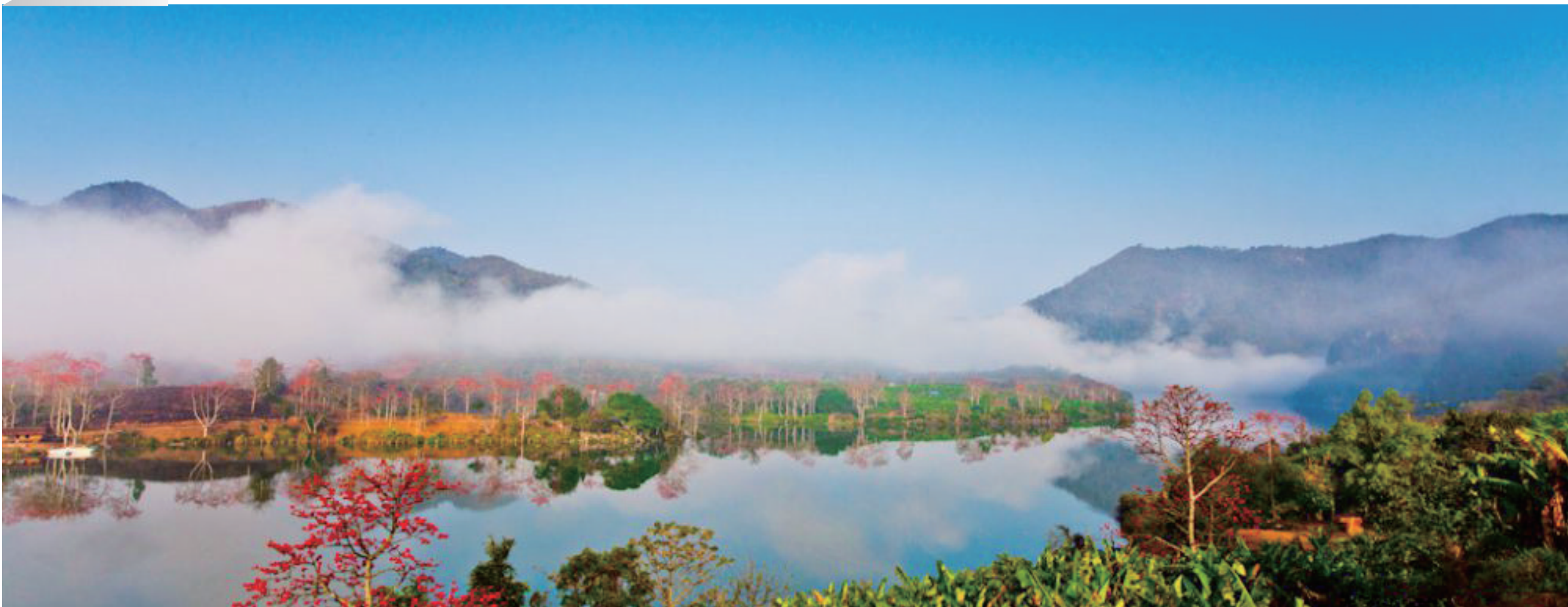
人间净土昌化江。