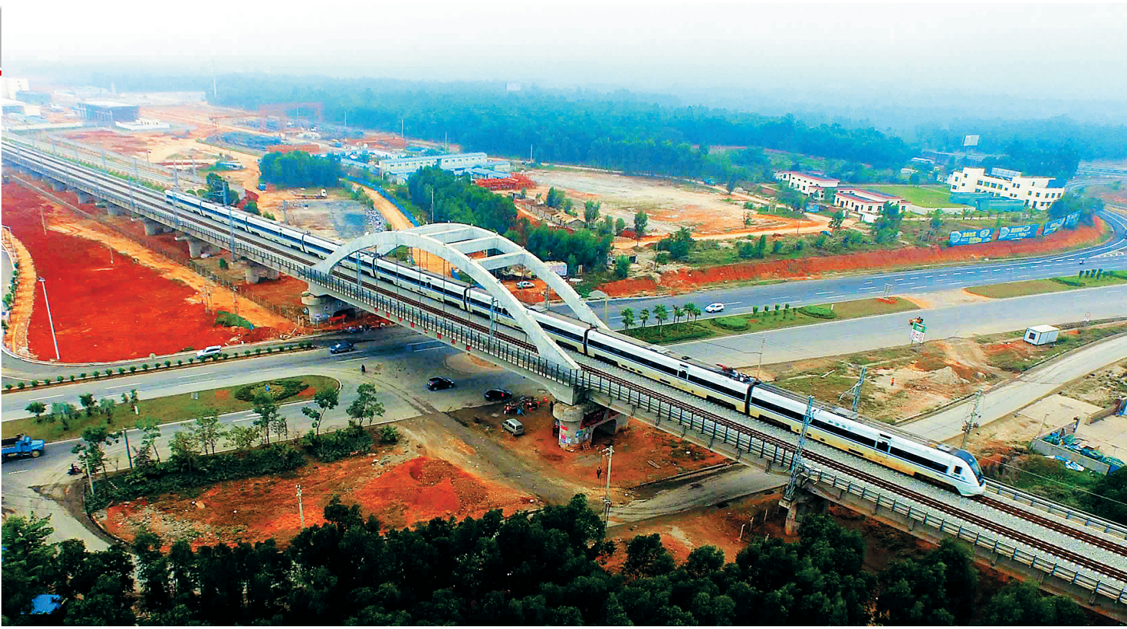
动车经过儋州白马井站的拱桥。