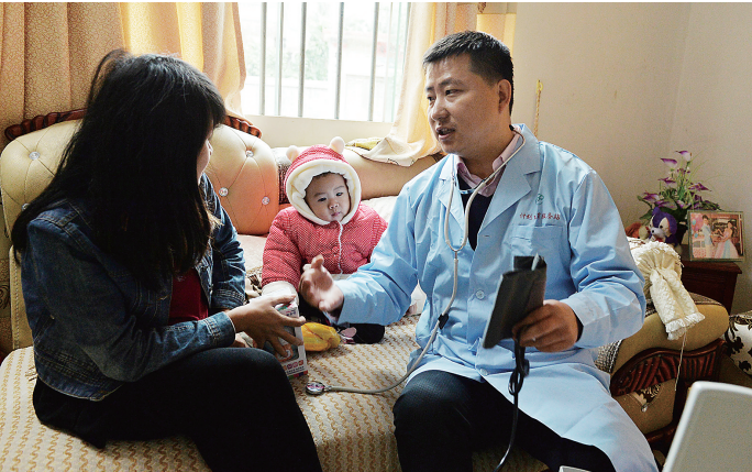
孕前优生检查和地贫筛检是阻断地贫的有效措施。图为万宁市后安镇一孕妇家中，计生服务站的工作人员免费为她进行健康检查。